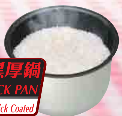
香檳 (Metallic Brown)