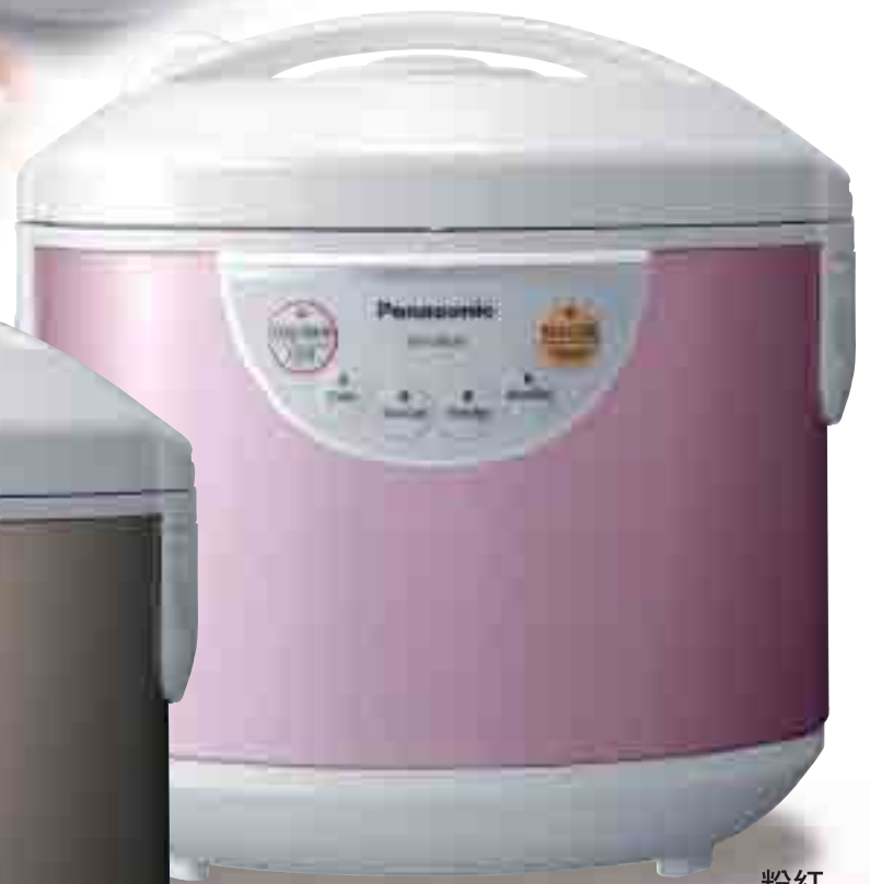
粉紅 (Crystal Pink)